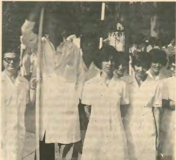
και των παρανόμων επεμβάσεων της στη Δ.Υ.

Όπως υποστηρίξαμε και στο προηγούμενο μας άρθρο για τους δημόσιους υπαλλήλους επιβάλλεται όπως αποφασιστικά προχωρήσουν στην απαίτηση των δικαιωμάτων τους χωρίς ταλαντεύσεις και υποχωρήσεις στις οποίες θα σπρώξει η κυβέρνηση όπως και στο παρελθόν